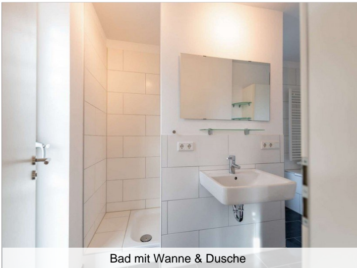
Bad mit Wanne & Dusche