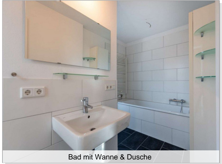
Bad mit Wanne & Dusche