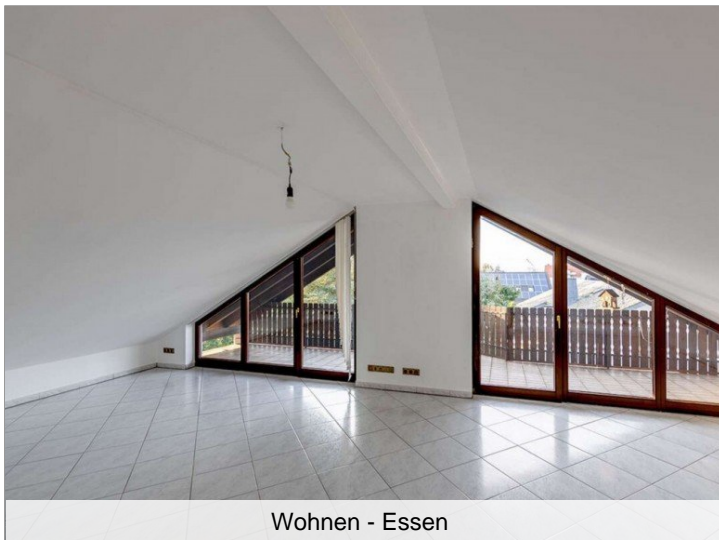
Wohnen - Essen